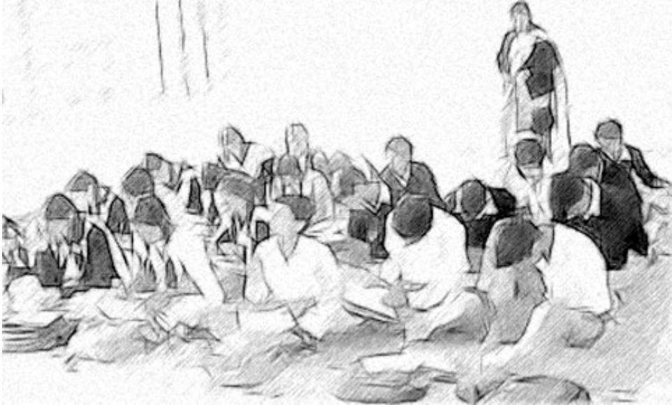
ಚಿತ್ರ 1 ಪ್ರತಿಯೊಂದು ಶಾಲೆಯಲ್ಲೂ ವೈವಿಧ್ಯತೆಯಿದೆ

ಯಶಸ್ವಿ ಸರ್ಕಾರಗಳು ವೈವಿಧ್ಯತೆಯನ್ನು ಆಚರಿಸುವ ಸಮುದಾಯಗಳನ್ನು ಶಿಕ್ಷಣದಲ್ಲಿ ಕೇಂದ್ರೀಕೃತ ಪಾತ್ರವನ್ನು ವಹಿಸಲು ಆಂತರಿಕರಣಗೊಳಿಸುವುದನ್ನು ಗುರುತಿಸುತ್ತವೆ. ನೀವು ಶಾಲಾ ನಾಯಕರಾಗಿ ನಿಮ್ಮ ಶಾಲಾ ಸಮುದಾಯದಲ್ಲಿ ಚಾಲ್ತಿಯಲ್ಲಿರುವ ವೈವಿಧ್ಯತೆಯನ್ನು ಗುರುತಿಸಲು ಮತ್ತು ಈ ವೈವಿಧ್ಯತೆಯನ್ನು ಕಲಿಕೆಗೆ ಸಂಪನ್ಮೂಲವಾಗಿ ಮತ್ತು ಅವಕಾಶವಾಗಿ ಎಷ್ಟು ಉತ್ತಮವಾಗಿ ಬಳಸಿಕೊಳ್ಳಬಹುದು ಸಮರ್ಥರರಿಬೇಕು.