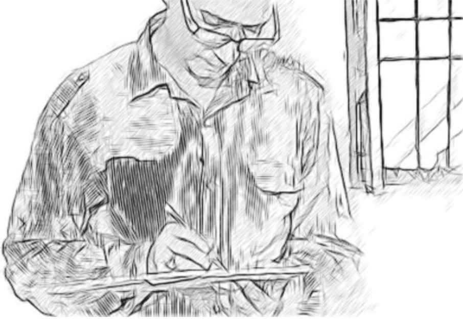
ಚಿತ್ರ 2 ವಿಭಿನ್ನತೆಯ ನಕ್ಷೆಯ ತಯಾರಿ

ವಿದ್ಯಾರ್ಥಿಗಳು ಹಲವಾರು ರೀತಿಯ ಅನುಭವಗಳು ಮತ್ತು ಸಂಪನ್ಮೂಲಗಳೊಂದಿಗೆ ಶಾಲೆಗೆ ನೊಂದಾವಣಿಯಾಗಿರುತ್ತಾರೆ. ಇವುಗಳು ಸ್ವಾಭಾವಿಕವಾಗಿಯೇ ಪ್ರತ್ಯಕ್ಷವಾಗಿ ಅಥವಾ ಪರೋಕ್ಷವಾಗಿ ಅವರ ಕಲಿಕೆಯ ಫಲಿತಾಂಶಗಳ ಮೇಲೆ ಪರಿಣಾಮಬೀರುತ್ತವೆ, ಮತ್ತು ನೀವು ಇದನ್ನು ಆರಂಭಿಕವಾಗಿ ನಿಮ್ಮ ಶಾಲೆಯಲ್ಲಿ ವಾಸ್ತವಿಕವಾಗಿರುವ ವಿಭಿನ್ನತೆಗಳ 'ನಕ್ಷೆಯನ್ನು' ತಯಾರಿಸಬೇಕು.