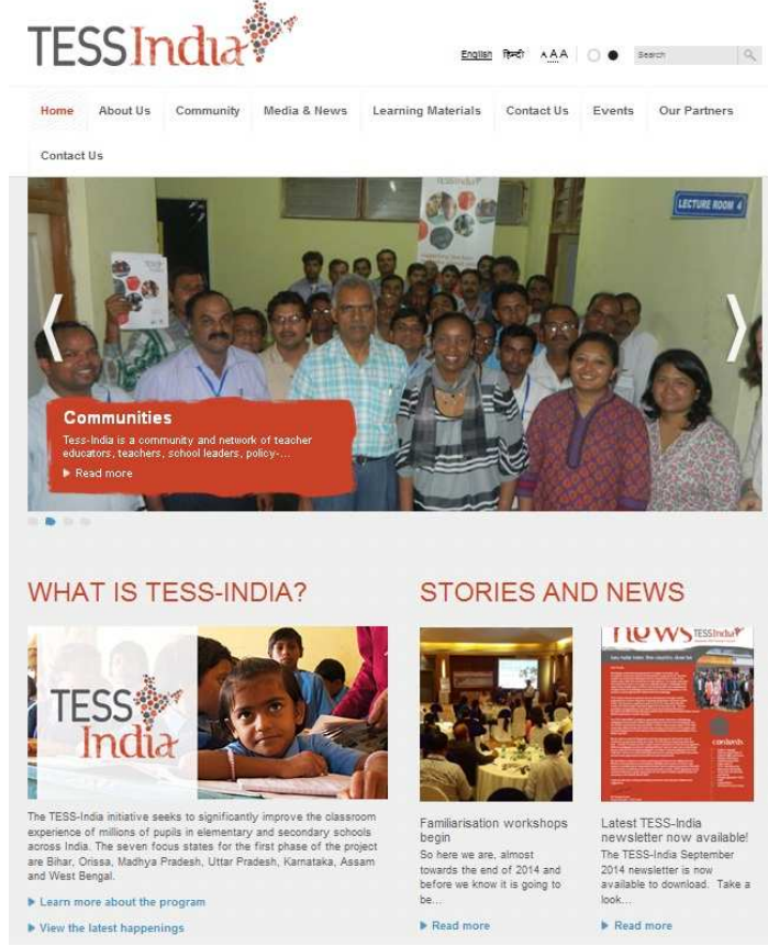
Figure 3 Units available from the TESS-India website are free for you to use.