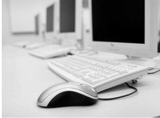
ಚಿತ್ರ-1 ಗಡಸು ಸಾಧನಗಳು ನಿಮ್ಮ ಶಾಲೆಗೆ ಲಾಭವನ್ನು ತರಬಹುದು

ತಂತ್ರಜ್ಞಾನವು ಕಂಪ್ಯೂಟರ್, ಲ್ಯಾಪ್ ಟಾಪ್, ಮೊಬೈಲ್ ಫೋನ್, ಸ್ಮಾರ್ಟ್ ಫೋನ್, ಟ್ಯಾಬ್ಲೆಟ್, ಪ್ರೊಜೆಕ್ಟರ್, ಪ್ರಿಂಟರ್, ಸ್ಕ್ಯಾನರ್, ಡಿಜಿಟಲ್ ಕ್ಯಾಮರಾ ಇತ್ಯಾದಿ ದೊಡ್ಡ ಸಾಂಪ್ರದಾಯಿಕ ಪ್ರಮಾಣದ ವಿವಿಧ ಉಪಕರಣಗಳನ್ನು ಒಳಗೊಂಡಿರುವುದು. ಇವುಗಳಲ್ಲಿ ಕೆಲವೊಂದನ್ನು ಸೂಕ್ತ ಸಾಫ್ಟ್‌ವೇರ್ ನೊಂದಿಗೆ ಉಪಯೋಗಿಸಬಹುದು. ಹಾಗೂ ಕೆಲವನ್ನು ಅಂತರ್ಜಾಲಕ್ಕೆ ಜೋಡಿಸಬಹುದು. ಮುಂಬರುವ ದಿನಗಳಲ್ಲಿ ಫೋನ್ ಗಳು ಟ್ಯಾಬ್ ಲೆಟ್ ಗಳು ಕಂಪ್ಯೂಟರ್ ಗಳಿಗಿಂತ ಸುಲಭವಾಗಿ ಲಭ್ಯವಾಗುವುದು. ಆದ್ದರಿಂದ ಈ ಬದಲಾವಣೆಗಳಿಗೆ ನಾವು ಹೆಚ್ಚು ಸ್ಪಂದಿಸಿ ಯೋಜನೆ ರೂಪಿಸಿಕೊಳ್ಳಬೇಕು. ಒಬ್ಬ ಶಾಲಾ ನಾಯಕರಾಗಿ ನೀವು ತಂತ್ರಜ್ಞಾನದಲ್ಲಾಗುತ್ತಿರುವ ಬೆಳವಣಿಗೆಗಳು ಮತ್ತು ಕಲಿಕೆಯ ಮೇಲೆ ಅವು ಬೀರುತ್ತಿರುವ ಪ್ರಭಾವಗಳ ಕುರಿತು ನೀವು ನಿಮ್ಮ ಅರಿವನ್ನು ಹೆಚ್ಚಿಸಿಕೊಳ್ಳಬೇಕು. ಹೀಗೆ ಮಾಡುವುದರಿಂದ ಶಾಲೆಯಲ್ಲಿ ಈ ತಂತ್ರಜ್ಞಾನವನ್ನು ಹೇಗೆ ಬಳಸಿಕೊಳ್ಳಬಹುದು ಎಂಬುದರ ಬಗ್ಗೆ ಅವಕಾಶಗಳಿಗಾಗಿ ನೀವು ಎದುರು ನೋಡಬಹುದು.