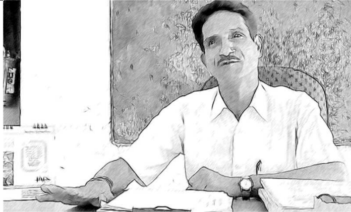
ಚಿತ್ರ-1 ಒಬ್ಬ ಆಲೋಚನಾಶೀಲ ನಾಯಕನ ಚಿತ್ರ