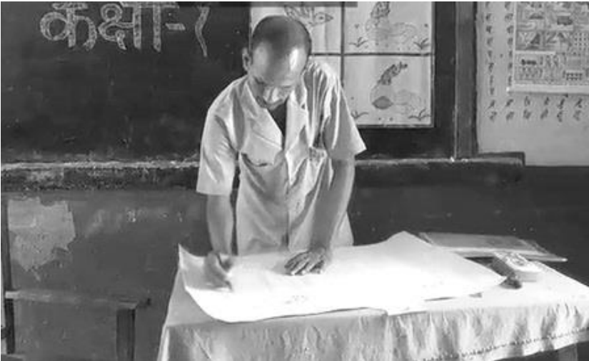
ಚಿತ್ರ 3 ಜೋಡಿಕೆಲಸದ ಪಾಠ ಯೋಜನೆ ಸಿದ್ಧತೆ.

ಸಂಪನ್ಮೂಲ 1 ಹಾಗೂ ಪ್ರಸಂಗ ಅಧ್ಯಯನ 1 ಮತ್ತು 2 ರಲ್ಲಿನ ವಿಚಾರ ಮತ್ತು ಮಾರ್ಗದರ್ಶನಗಳನ್ನು ಉಪಯೋಗಿಸಿಕೊಂಡು, ವಿದ್ಯಾರ್ಥಿಗಳು ಮಾತನಾಡಲು ಮತ್ತು ಬರೆಯಲು ಇಷ್ಟ ಪಡಬಹುದಾದ ವಿಷಯ ವಸ್ತುವನ್ನು ಆರಿಸಿಕೊಳ್ಳಿ. ಇದು ತರಗತಿಯ ಭಾಷಾ ಪಠ್ಯವು ಸ್ವತಃ, ಅಥವಾ ಇತರ ವಿಷಯ, ಸಮುದಾಯದಲ್ಲಿನ ಇತ್ತೀಚಿನ ಹಬ್ಬ ಉತ್ಸವ, ಅಥವಾ ಸ್ಥಳೀಯ/ರಾಷ್ಟ್ರೀಯ ಸುದ್ದಿಯನ್ನು ಆಧರಿಸಿರಬಹುದು. ಜೋಡಿ ಕೆಲಸಕ್ಕೆ ಮುಂಚಿತವಾಗಿ, ನಿಮ್ಮ ವಿದ್ಯಾರ್ಥಿಗಳಿಗೆ ಸ್ಪೂರ್ತಿ ಕೊಡಬಹುದಾದ 'ಓದು' ಯಾವುದಿರಬಹುದು ಹಾಗೂ ಕೆಲಸದ ನಂತರ ಕೊಡಬೇಕಾದ ಓದುವಿಕೆ ಅವಕಾಶಗಳನ್ನು ಕುರಿತು ಆಲೋಚಿಸಿ.