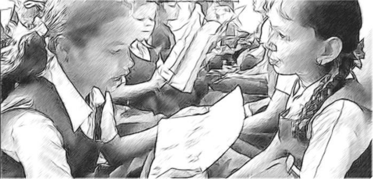
ಚಿತ್ರ 1. ನಾಗರಹಾವು ಮತ್ತು ಮುಂಗುಸಿಯ ಚಟುವಟಿಕೆಯಲ್ಲಿ ತೊಡಗಿರುವುದು

ನಂತರ ಪಕ್ಕದ ಸಹಪಾಠಿಯೊಂದಿಗೆ ಕಾರ್ಯನಿರತವಾಗುವಂತೆ ವಿದ್ಯಾರ್ಥಿಗಳಿಗೆ ಹೇಳಿದೆ. ಒಬ್ಬರು ನಾಗರಹಾವು ಎಂದು, ಮತ್ತೊಬ್ಬರು ಮುಂಗುಸಿ ಎಂದು ನಿರ್ಧರಿಸುವಂತೆ ಹೇಳಿದೆ ಹಾಗೂ ಕಾಡಿನಲ್ಲಿ ಭೇಟಿಯಾದಾಗ, ಏನು ಹೇಳುತ್ತೀರೆಂದು ಆಲೋಚಿಸಬೇಕೆಂದು ಹೇಳಿದೆ. 15 ನಿಮಿಷಗಳನ್ನು ಕೊಟ್ಟು, ಎರಡು ಪ್ರಾಣಿಗಳ ಸಂಭಾಷಣೆಯನ್ನು ಚರ್ಚಿಸಲು ಸೂಚನೆ ನೀಡಿದೆ, ಅವರು ಇಚ್ಛಿಸಿದಲ್ಲಿ, ಆಂಗಿಕ ಭಾಷೆ, ನಟನೆ ಮತ್ತು ಧ್ವನಿ ಬದಲಾಯಿಸಿ ಸಂಭಾಷಿಸಬಹುದೆಂದು ಹೇಳಿದೆ. ಕೆಲವು ವಿದ್ಯಾರ್ಥಿಗಳು ಸಂಭಾಷಣೆಗೆ ತಮ್ಮ ಮನೆಭಾಷೆಯನ್ನು ಅಥವಾ ಮನೆಭಾಷೆ ಮತ್ತು ಶಾಲಾ ಭಾಷೆಗಳೆರಡನ್ನು ಬಳಸಿಕೊಳ್ಳ ಬಯಸಿದರು. ಅವರು ಕಾರ್ಯನಿರತರಾಗಿದ್ದಾಗ, ಪರಿವೀಕ್ಷಿಸುತ್ತಾ, ಅವರ ಮನವಿಯಂತೆ, ಪ್ರಮುಖ ಪದಗಳನ್ನು ಹಲಗೆಯ ಮೇಲೆ ಬರೆಯತೊಡಗಿದೆ. ಅನೇಕ ವಿದ್ಯಾರ್ಥಿಗಳು ಪಾತ್ರಗಳಿಗೆ ಜೀವತುಂಬಿ ಮಾತನಾಡುತ್ತಿದ್ದರು.