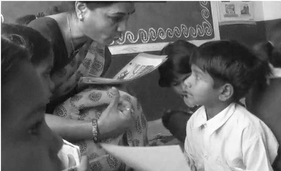
ಚಿತ್ರ 2: ಜೋಡಿಕೆಲಸವನ್ನು ಪರಿವೀಕ್ಷಿಸುವುದು

ಮೌಲ್ಯಾಂಕನವು ಕೆಳಗೆ ಕೊಟ್ಟಿರುವ ರೀತಿಗಳಲ್ಲಿ ವಿದ್ಯಾರ್ಥಿಗಳ ಭಾಷಾ ಬೆಳವಣಿಗೆಗೆ ಸಂಬಂಧ ಕಲ್ಪಿಸಬಹುದು.