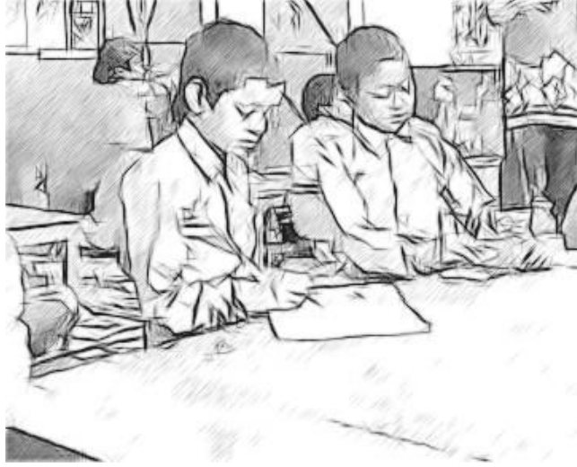
ಚಿತ್ರ 3 ಪತ್ರವನ್ನು ಬರೆಯುತ್ತಿರುವುದು

ನನ್ನ ವಿದ್ಯಾರ್ಥಿಗಳು ಮಾನ್ಯ ಮಹಾಪೌರರಿಗೆ (ಮೇಯರ್) ಒಂದು ಪ್ರತಿಭಟನಾ ಪತ್ರವನ್ನು ಬರೆಯಬೇಕೆಂದುಕೊಂಡಿದ್ದರು. ಇದಕ್ಕಾಗಿ ನಾನು ಸಹಾಯ ಮಾಡಲು ಒಪ್ಪಿದೆ. ಪ್ರತಿ ಆರು ವಿದ್ಯಾರ್ಥಿಗಳ ಗುಂಪಿಗೆ ಕಾಗದವನ್ನು ಕೊಟ್ಟು, ತಾವು ಹೇಳಬೇಕಾದ ಮುಖ್ಯಾಂಶಗಳನ್ನು ಬರೆಯುವಂತೆ ಹೇಳಿದೆ.