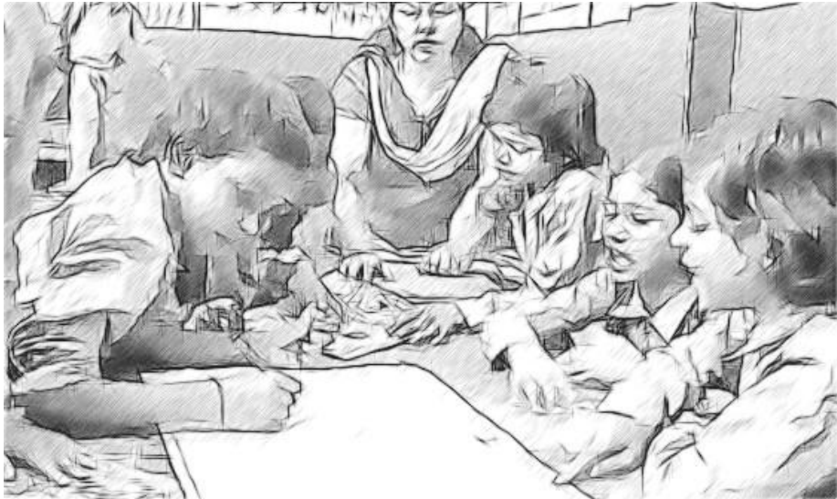
ಚಿತ್ರ 2 ಒಂದು ಗುಂಪು ಕಥೆ ಬರೆಯಲು ನಿರತರಾಗಿರುವುದು

ಪ್ರತಿಯೊಬ್ಬರೂ ಹೇಳಿದ ಮೇಲೆ, ಕಪ್ಪುಹಲಗೆಯ ಮೇಲಿನ ಪದಗಳನ್ನು ತೋರಿಸುತ್ತಾ, ಅವರು ಹೇಳಿರುವುದನ್ನು ಓದುತ್ತೇನೆ. ನಂತರ ನಾವು ವಾಕ್ಯಗಳನ್ನು ಗಮನಿಸಿ, ಒಂದು ಸಮಂಜಸವಾದ ಕಥೆಯನ್ನು ಮಾಡಲು ಅವುಗಳನ್ನು ಪುನರ್ ಜೋಡಿಸುತ್ತೇನೆ. ಆಸಕ್ತಿದಾಯಕವಾಗಿ ಮಾಡಲು, ಅದರ ಹರಿವು ಇರುವಂತೆ ನೋಡಿಕೊಳ್ಳಲು ಕೆಲವು ಪದ/ಪದಗುಚ್ಛಗಳನ್ನು ಸೇರಿಸುತ್ತಾ ಎಲ್ಲರೂ ಕಥೆಯನ್ನು ಗಟ್ಟಿಯಾಗಿ ಓದುತ್ತೇವೆ. ಎಲ್ಲರಿಗೂ ಕಥೆ ಚೆನ್ನಾಗಿದೆ ಎಂದು ಎನಿಸಿದಾಗ, ನಾವು ಒಂದು ಸೂಕ್ತ ಶೀರ್ಷಿಕೆಯನ್ನು ಕೊಡುತ್ತೇವೆ.