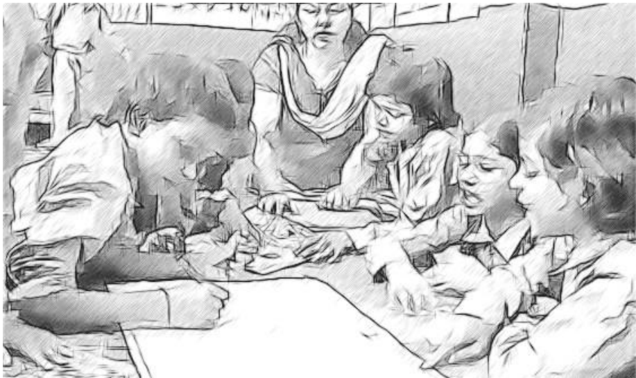
ಚಿತ್ರ 2 ಒಂದು ಗುಂಪು ಕಥೆ ಬರೆಯಲು ನಿರತರಾಗಿರುವುದು

ಆಸಕ್ತಿದಾಯಕವಾಗಿ ಮಾಡಲು, ಅದರ ಹರಿವು ಇರುವಂತೆ ನೋಡಿಕೊಳ್ಳಲು ಕೆಲವು ಪದ/ಪದಗುಚ್ಛಗಳನ್ನು ಸೇರಿಸುತ್ತಾ ಎಲ್ಲರೂ ಕಥೆಯನ್ನು ಗಟ್ಟಿಯಾಗಿ ಓದುತ್ತೇವೆ. ಎಲ್ಲರಿಗೂ ಕಥೆ ಚೆನ್ನಾಗಿದೆ ಎಂದು ಎನಿಸಿದಾಗ, ನಾವು ಒಂದು ಸೂಕ್ತ ಶೀರ್ಷಿಕೆಯನ್ನು ಕೊಡುತ್ತೇವೆ.